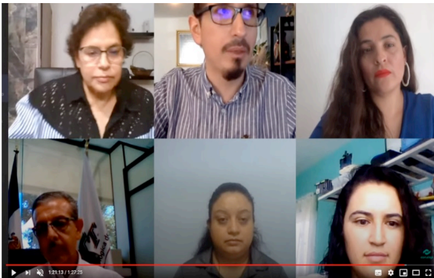
Webinar: Proyecto de Vida y Carrera CONALEP - Sesión 1. 14/07/20